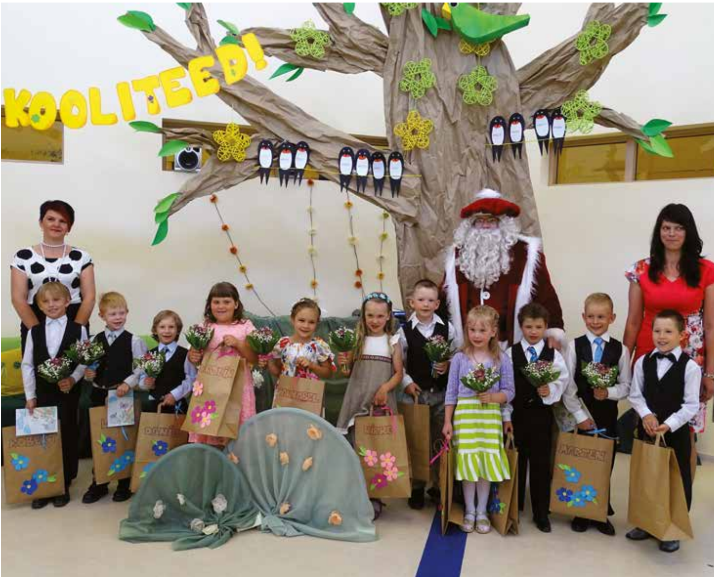
Esimesed seitsmeaastased saadeti kooliteele uuest lasteaiast Pargihaldjas.