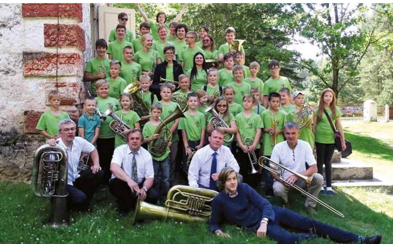
Vaskpuhkpilli suvekooli Paganamaa Brass 43 õpilast andsid kontserdi Pindi kirikus 10. juulil.