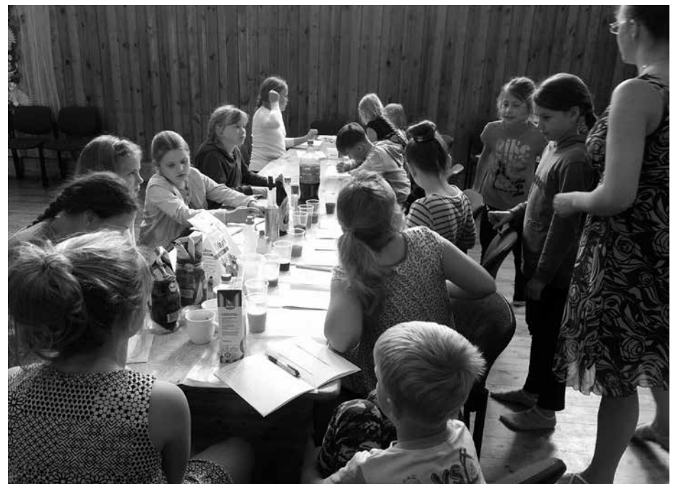
Selleks, et hinnata kas aine on aluseline või happeline kasutasid lapsed indikaatorina punase kapsa keeduvedelikku.