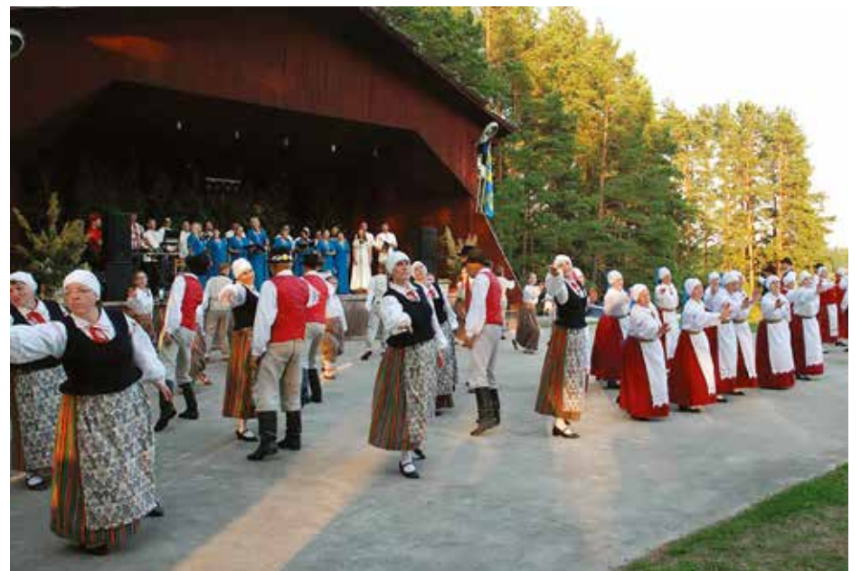
Taas oli Kääpa laululava tantsijate ja lauljate päralt 25. juunil.

Eesti Kultuurkapital Võrumaa Ekspertgrupp