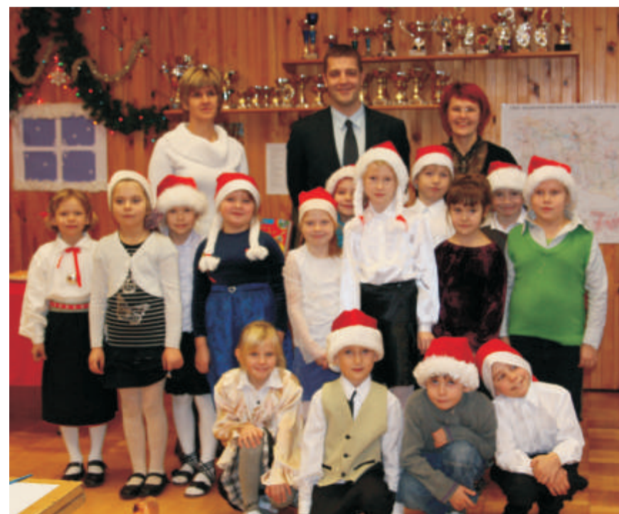
I klassi õpilaste vastuvõtt vallavanema juures seoses 100 päeva möödumisega koolitee algusest.

Lasva vallavalitsus Toimetaja: Silja Vijar, tel. 789 8289, tel. 5193 6948 vald@lasva.ee ; silja@lasva.ee Trükk: TT Print OÜ Trükiarv 650