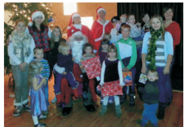
Mudilaste jõulud Tsolgo rahvamajas.