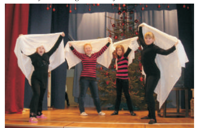
Jõuluetendus Lasva rahvamajas.