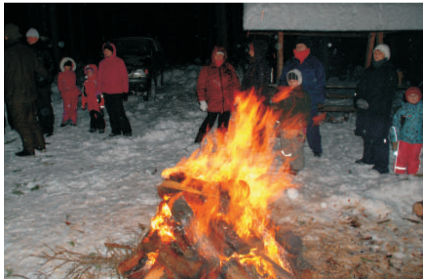
Jõulurahu väljakuulutamise Kotkapalus Lasva jahimeeste ja kepikõndijate seltsingu poolt